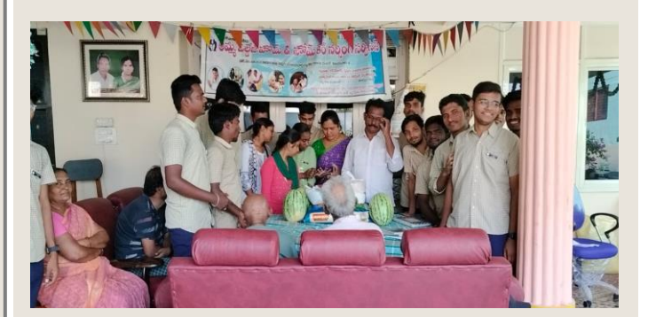
Students of Good habits club have donated necessaries to Amma oldage home.