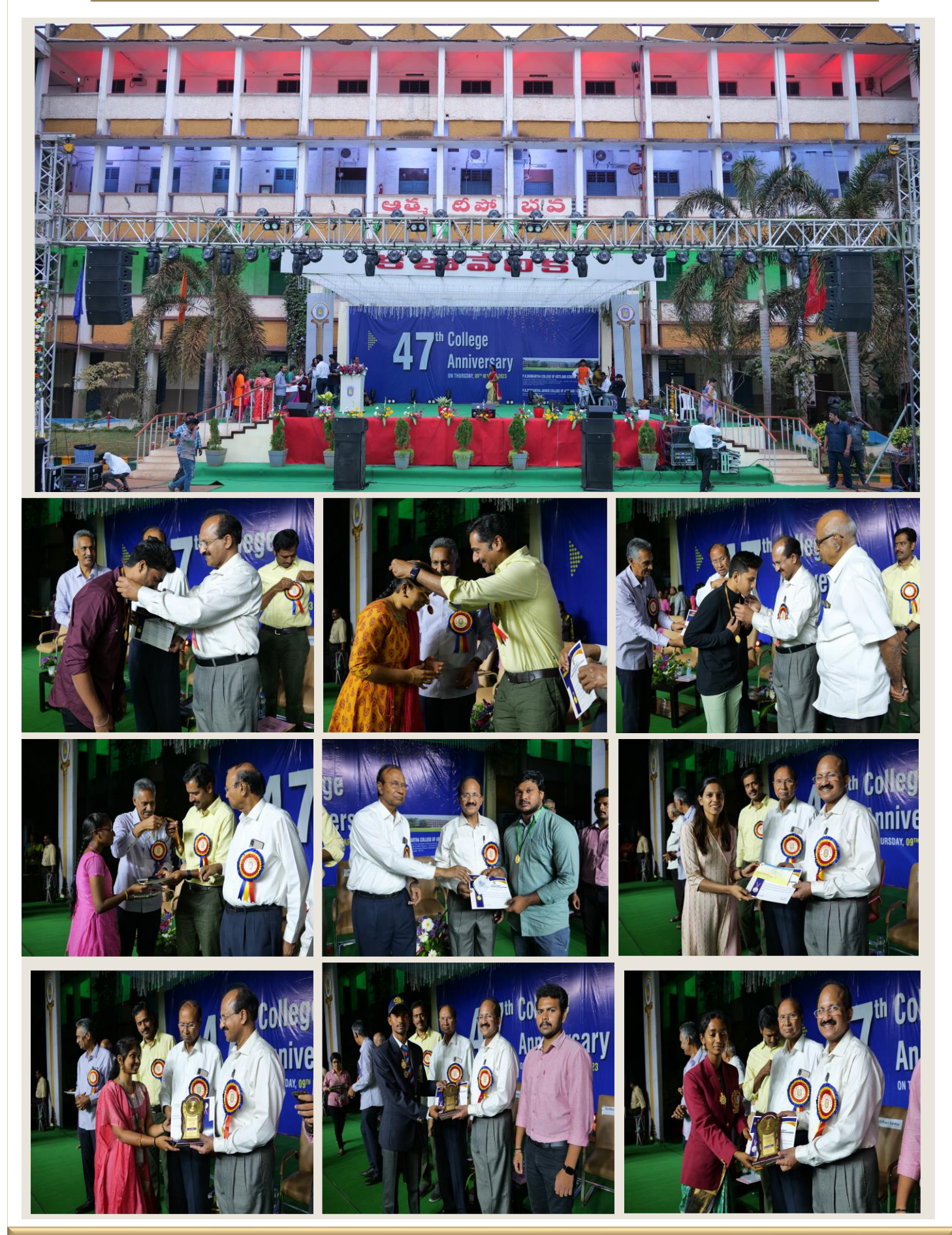
P.B. SIDDHARTHA COLLEGE OF ARTS & SCIENCE:: Mogalrajpuram, Siddhartha Nagar, Vijayawada-10 sponsors: Siddhartha Academy of General & Technical education