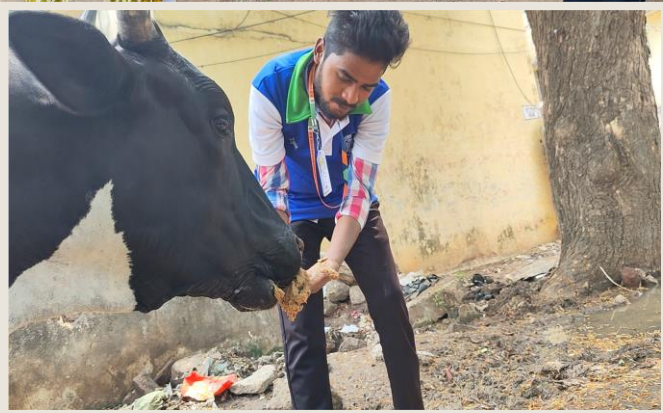
On 26<sup>th</sup> march 2023, NSS Unit-I has taken a step forward with a great move i.e. feeding the cows in the streets of BRTS Road, Satyanarayana Puram, Gandhi Nagar as those cows could not get the food daily.